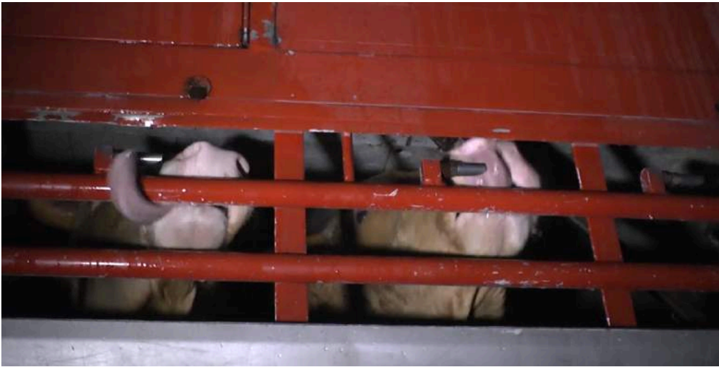
Souvent, les animaux sont assoiffés.

Exténuant, le transport par camion dure plusieurs jours, voire une semaine entière, et il est fréquent que les animaux succombent dans les remorques des camions. Ils souffrent d'épuisement, de déshydratation, de blessures, de maladies... Les individus faibles, les nouveau-nés et les femelles en gestation n'échappent pas à ces transports sur longues distances. Les jeunes veaux sont séparés de leur mère, privés de nourriture, et forcés à se tenir debout dans des espaces surpeuplés, où ils sont écrasés par leurs congénères.