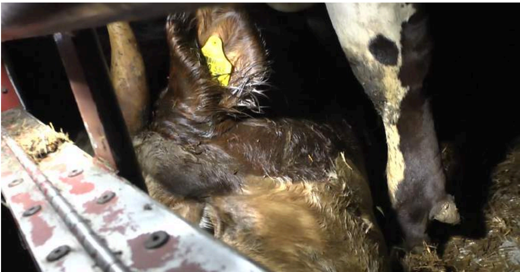
Il est fréquent que des animaux meurent pendant le transport.