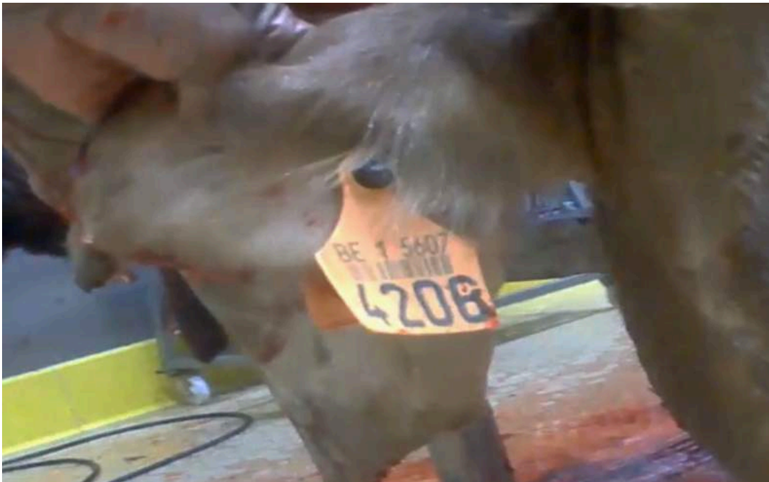
Dans un abattoir turc, les enquêteurs ont filmé ce bovin provenant de Belgique.