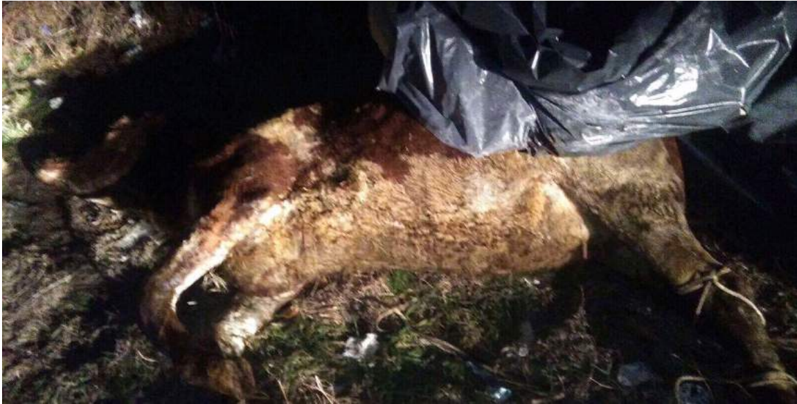
Cette photo, prise à l'aéroport de Liège, montre un bovin mort qui devait être envoyé au Koweït.