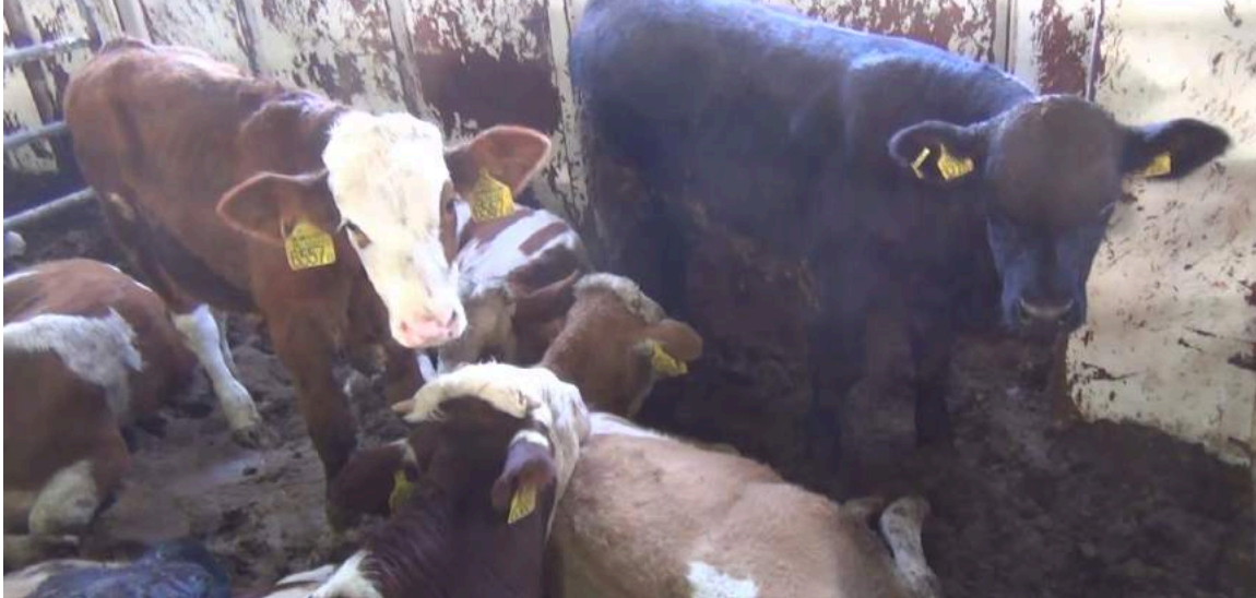
A bord pendant plusieurs jours, les animaux souffrent de la faim et de l'épuisement.