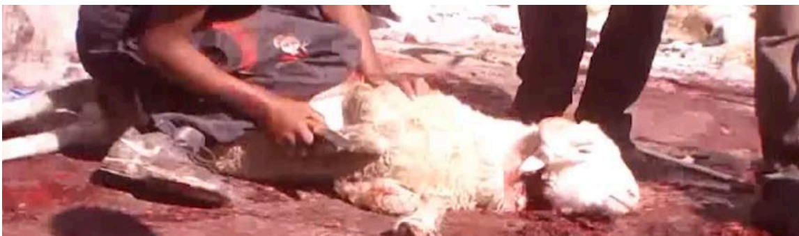
Dans des pays comme la Jordanie, les animaux européens sont abattus sur les marchés.

L'investigation diffusée par GAIA donne également un aperçu de la manière choquante dont sont abattus les animaux européens en Turquie et au Moyen-Orient. L'égorgeage sans étourdissement y est la règle. Outre la cruauté de la méthode, les sacrificateurs au Moyen-Orient font preuve d'un grave amateurisme, et poignent à plusieurs reprises la gorge des animaux, qui agonisent lentement tandis qu'ils ont les membres liés par des cordes. Les animaux sont égorgés sur les marchés ou en pleine rue, dans des conditions de stress et de souffrance indescriptibles. Les enquêteurs ont aussi pu filmer l'intérieur d'un abattoir turc, qui abat notamment des bovins belges dans des conditions déplorables de souffrance animale et d'hygiène.