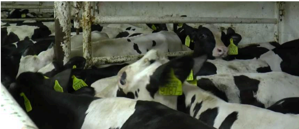
Aucun vétérinaire n'est présent pour soigner les animaux blessés ou malades.

Des exportations d'animaux vivants ont également lieu par avion, y compris depuis la Belgique. GAIA a été informé de transports de bovins depuis l'aéroport de Liège. Le vol est à destination du Koweït et est assuré par Ethiopian Airlines. Notre informateur a particulièrement été témoin d'un cas, pendant le mois de janvier 2017, lors duquel les bovins sont restés au moins une journée dans la remorque glaciale d'un camion à l'aéroport, sans eau ni nourriture, en raison d'un vol qui n'a pas pu avoir lieu. Une vache en gestation est morte à bord du camion.