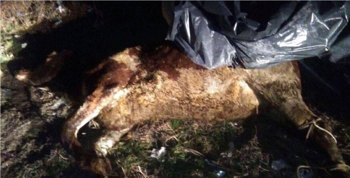
In deze foto ziet u een dood rund dat van Luik naar Koeweit zou gevlogen worden.