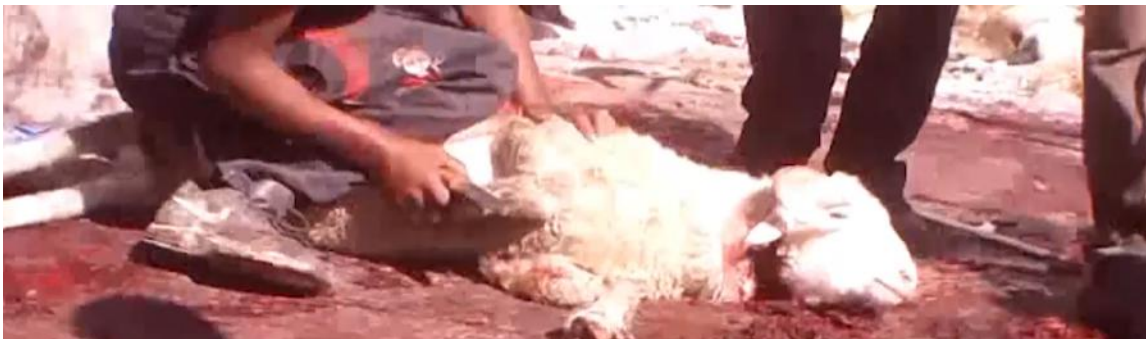
In landen zoals Jordanië worden Europese dieren op markten geslacht.

De onderzoeksvideo geeft ook een overzicht van de stuitende manier waarop de Europese dieren in Turkije en het Midden-Oosten worden geslacht. Onverdoofd slachten is de norm. Niet alleen is deze methode heel wreed, de offeraars in het Midden-Oosten gaan ook erg amateuristisch te werk. Ze steken meermaals een mes in de keel van de dieren, die langzaam een pijnlijke dood sterven terwijl hun ledematen met touwen vastgebonden zijn. De dieren worden in erbarmelijke omstandigheden op markten of op straat gekeeld. De onderzoekers konden ook in een Turks slachthuis filmen, waar onder meer Belgische runderen geslacht worden in erbarmelijke omstandigheden op het vlak van dierenwelzijn en hygiëne.