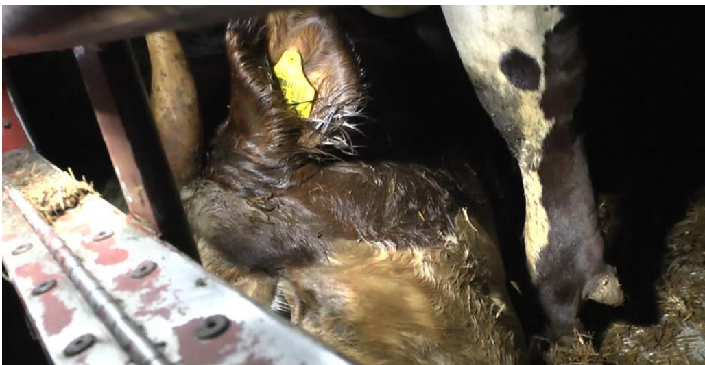
Dieren sterven regelmatig tijdens het transport.