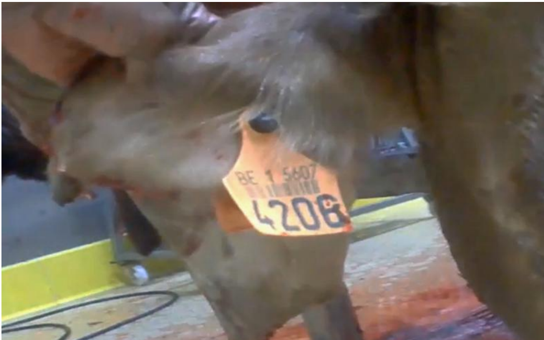
In een Turks slachthuis filmde de onderzoekers dit Belgisch rund.