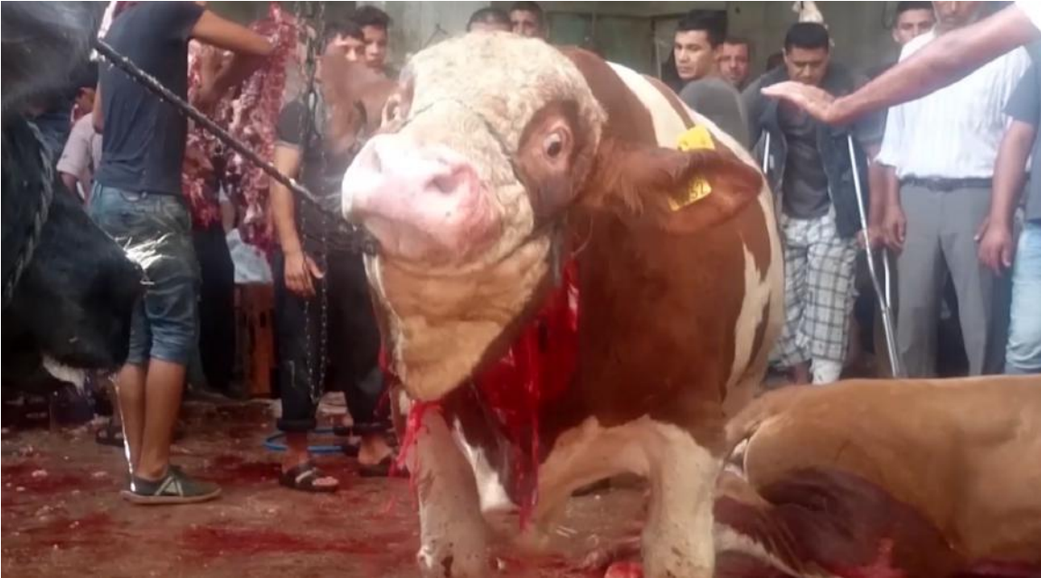
Ze worden ook op straat gekeeld, zoals hier in Palestina.