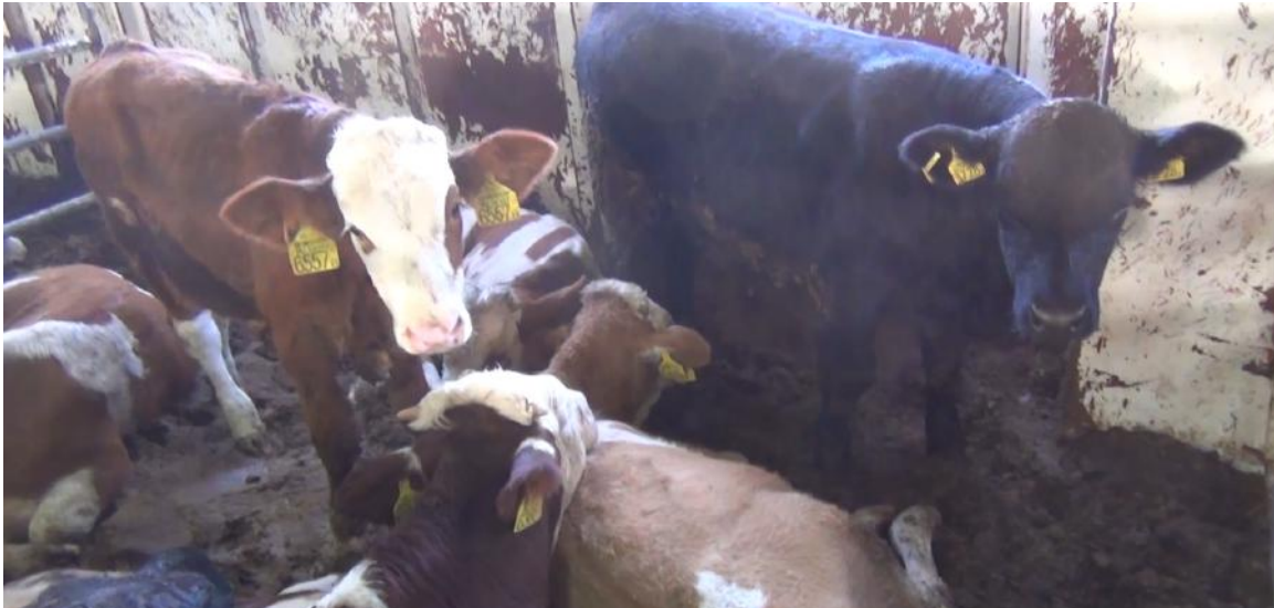
De dieren zijn vele dagen onderweg. Ze lijden honger en zijn uitgeput.