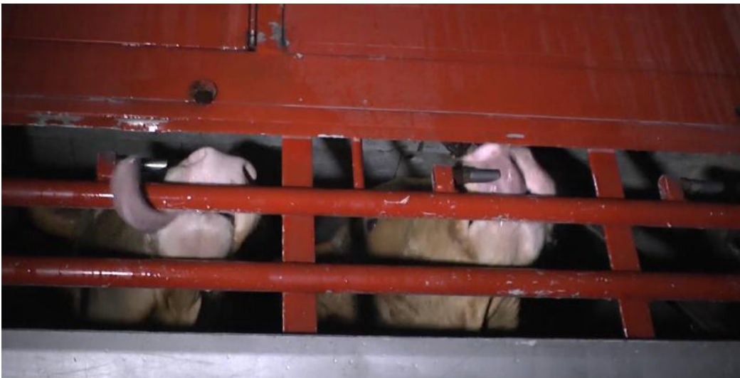
De dieren lijden vaak verschrikkelijke dorst.

Transport per vrachtwagen duurt verscheidene dagen tot zelfs een hele week en put de dieren uit. Vaak sterven dieren onderweg. De dieren lijden onder uitputting, uitdroging, verwondingen, ziekten ... Drachtige, zwakke en pasgeboren dieren ontsnappen niet aan deze verre veetransporten. De jonge kalveren worden bij hun moeder weggehaald, krijgen geen eten en worden gedwongen recht te blijven staan in overvolle vrachtwagens, waar ze door hun soortgenoten verpletterd worden.