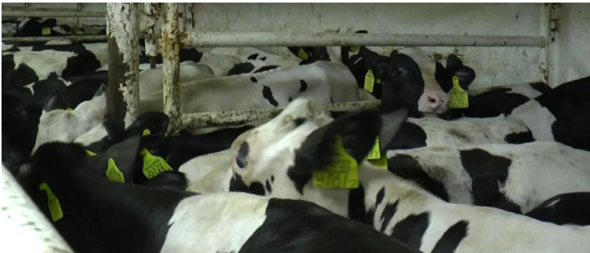
Er is geen dierenarts aanwezig om gewonde en zieke dieren te verzorgen.

Er worden ook levende dieren geëxporteerd per vliegtuig, ook vanuit België. GAIA kreeg te horen dat er vanuit de luchthaven van Luik rundertransporten vertrekken met Ethiopian Airlines. De bestemming: Koeweit. Onze informant was onder meer getuige van een voorval in januari 2017, toen een vlucht niet kon doorgaan. De runderen moesten op de luchthaven minstens één dag in de ijsskoude aanhangwagens van een vrachtwagen blijven, zonder water of voedsel. Een drachtige koe is gestorven aan boord van de vrachtwagen.