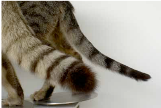
Figuur 1 : De staarten van de wilde kat (vooraan) en de huiskat (achteraan)