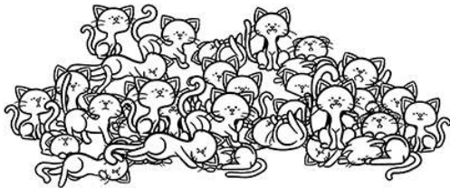
Année 3 : 200 chatons